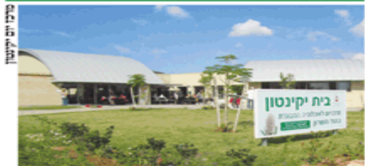
מרכז יום קיינטון