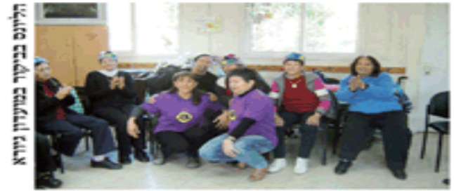
חילום בביתור במעון ניוא