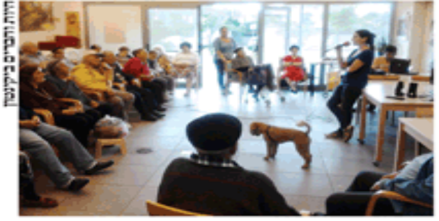
חיות וחברים ביקניסון